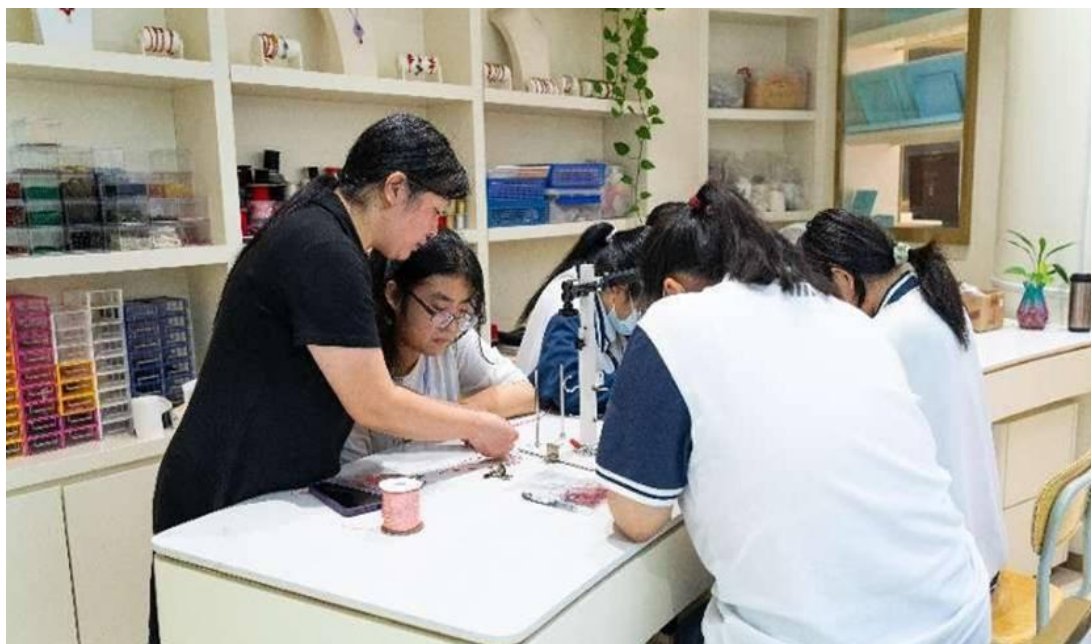
图 2-1 “经雅”团队研发绳艺饰品

校企共建“经雅”时尚珠宝项目，由非遗大师带领骨干教师与企业技术人员、学生组成创新团队，实行传承花丝镶嵌、黄金烧蓝、金银錾刻等非遗技艺，开发时尚首饰 15 个系列 1200 余款，累计获批外观设计专利 17 项。2025 年“经雅”黄金品牌入选“青岛礼物”城市品牌，实现产教融合成果向区域文化品牌的有效转化。创新团队打造“圆梦”系列首饰，由奥运冠军陈梦佩戴亮相巴黎奥运赛场，走向世界舞台，引发广泛关注与社会共鸣，彰显职业教育服务产业升级与文化输出的双重价值。