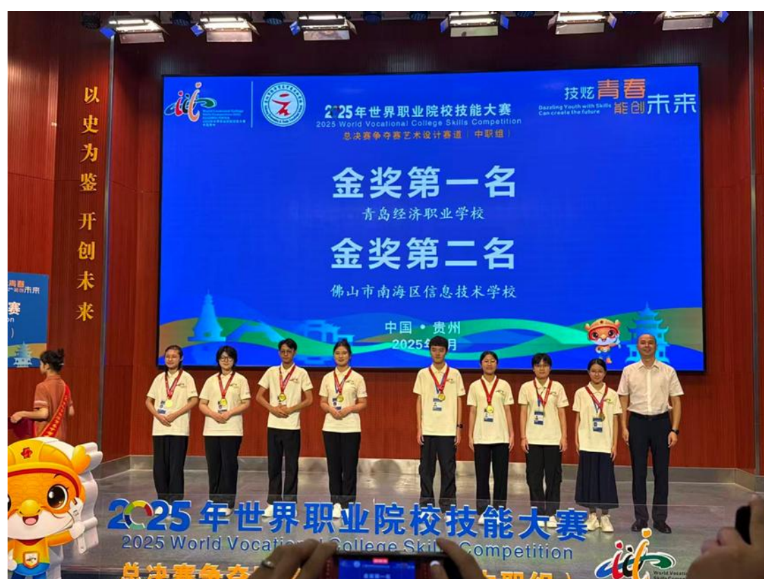
图 1-1 学生在 2025 年世校赛艺术设计赛道斩获金奖第一名

学校以教育部美术造型技能大赛为牵引，构建多元赛项体系，覆盖商贸、艺术设计、药剂等专业，实现教育部门竞赛中商务与药剂类赛项历史性突破，形成“广覆盖、强专业、全层级”竞赛格局。竞赛成果高效转化为教学科研动能。教师依托赛题开发出版 5 本数字化教材、1 本纸质教材，将典型竞赛案例融入课程，打造“赛教一体”实战课堂；基于赛场创新申报外观专利 5 项，两项研究立项山东省职业教改重点课题，构建“赛—教—研”闭环，显著提高专业内涵与人才培养质量。