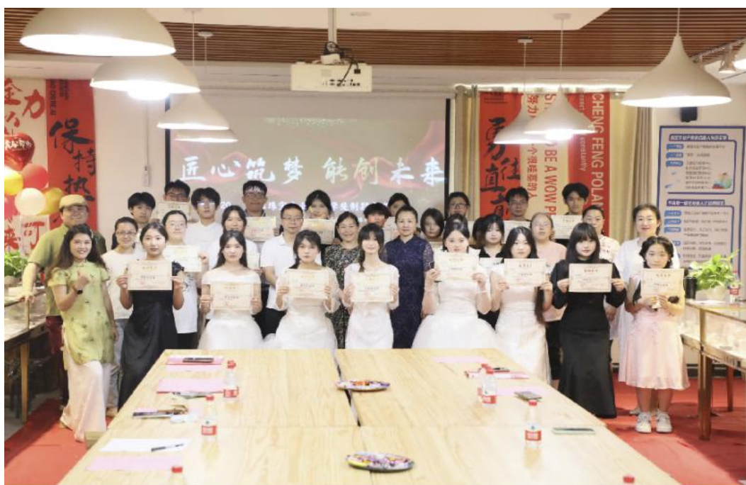
图 5-5 学校召开珠宝现代学徒制考核会

善 9 个初中后五年制高职人才培养方案，并上报省教育厅；依托紧密合作企业，学校专业带头人、骨干教师等与行业企业专家密切合作，陆续开发、修订现代学徒制、精品课程、课程改革类校本教材 18 本；珠宝、医药、计算机和国际商务四大专业联合 8 家企业开展 5 个现代学徒青岛未来工匠人才培养项目。依托学徒制办学特色，完成 5 本人才培养方案、5 本现代学徒制实施方案、5 本学徒生手册；学校以行业企业岗位需求为目标，针对典型工作任务开展教育教学，不断提升服务行业企业的水平。