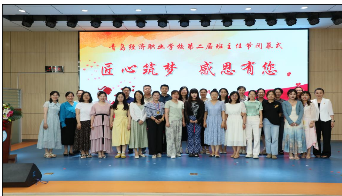
图 1-7 学校“匠心筑梦，感恩有您”第二届班主任节

学校举办“匠心筑梦，感恩有您”第二届班主任节。班主任代表发言，表达了对教育事业的热爱与执着。家长代表发言，对班主任的辛勤付出表示衷心的感谢。学生用舞蹈和朗诵向班主任表达了敬意与感激之情。党总支书记致辞，高度赞扬了班主任们用实际行动诠释着“立德树人”的深刻内涵，对家长们的支持与配合表示感谢，并鼓励同学们将尊师重教的传统美德融入日常学习生活中。此次班主任节不仅加深了全校班主任和学生之间的情感联系，增强了家校沟通，更展现了学校师生团结一心、积极向上的精神风貌，弘扬了尊师重教的传统美德。