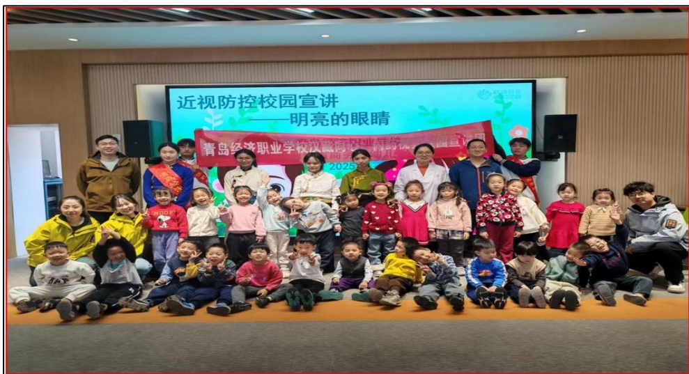
图 6-6 汉藏同心宣讲团来到山东省商务厅幼儿园

5. 唯旗必夺、全力取得各项成绩。获评教育部“第三批全国学校急救教育试点校”称号；承办市教育局、市教科院、市文旅局联合举办的青岛市中职思政大课堂交流活动；汉藏师生代表第三次受团市委邀请参加 2025 年“十八岁成人仪式”；获评市教育局“技能成才强国有我”一等奖 1 个、二等奖 2 个、三等奖 1 个；获评市教育局“家访好故事”二等奖 1 个、“家校金点子”二等奖和三等奖各 1 个；获评市教育局“五四红旗团委优秀团支部”1 个；获评市教育局“思政微课堂”宣讲比赛二等奖 1 人；青岛市乒乓球比赛职高组获男单第一名和第五名、男双第一名和第七名、男团第六名、女双第六名、混双第三名和第八名；青岛市女子篮球赛职高组第四名；青岛市羽毛球赛职高组女子混双第五名；校合唱团首次参加市合唱比赛，获评三等奖；校辩论队参加青岛市辩论赛表现优异。