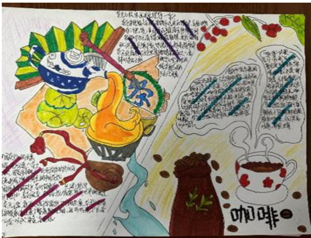
图 4-2 中西方文化赏析社团学生作品