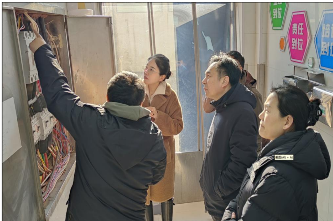
图 6-1 学校领导班子到重点区域实地检查

此次安全检查为新学期的教学工作提供了有力的安全保障。学校将持续加强校园安全管理工作，建立健全安全长效机制，确保校园安全；开学在即，学校将以更加安全、和谐的环境迎接每一位师生的返校，共同开启新学期的美好篇章。