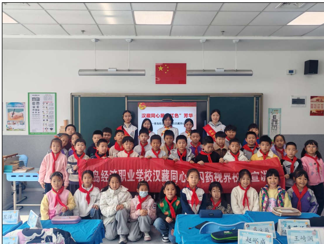
图 1-10 汉藏同心宣讲团来到青岛育新小学宣讲

愿服务新模式，形成“专业运用+社会实践+服务民生”三闭环，受益人逐步扩大至 500 余人，有效传播铸牢中华民族共同体意识。