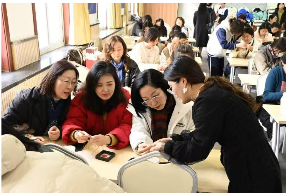
图 2-2 珠宝非遗技艺培训

2. 匠心助老添活力，专业惠民润社区。学校以服务育人为理念，发挥优势特色专业师资和资源优势，结合特色专业，开发适合老年人的课程，送课进社区，引课进学校，为广大社区老年居民提供珠宝类、医药类教育服务，丰富了社区老年教育培训内容，满足了居民多种教育培训需求，促进了老年教育事业发展。通过持续开展老年教育公益课堂等活动，极大满足了老年居民多层次、多种类教育的需求，促进了老年教育事业的蓬勃发展。