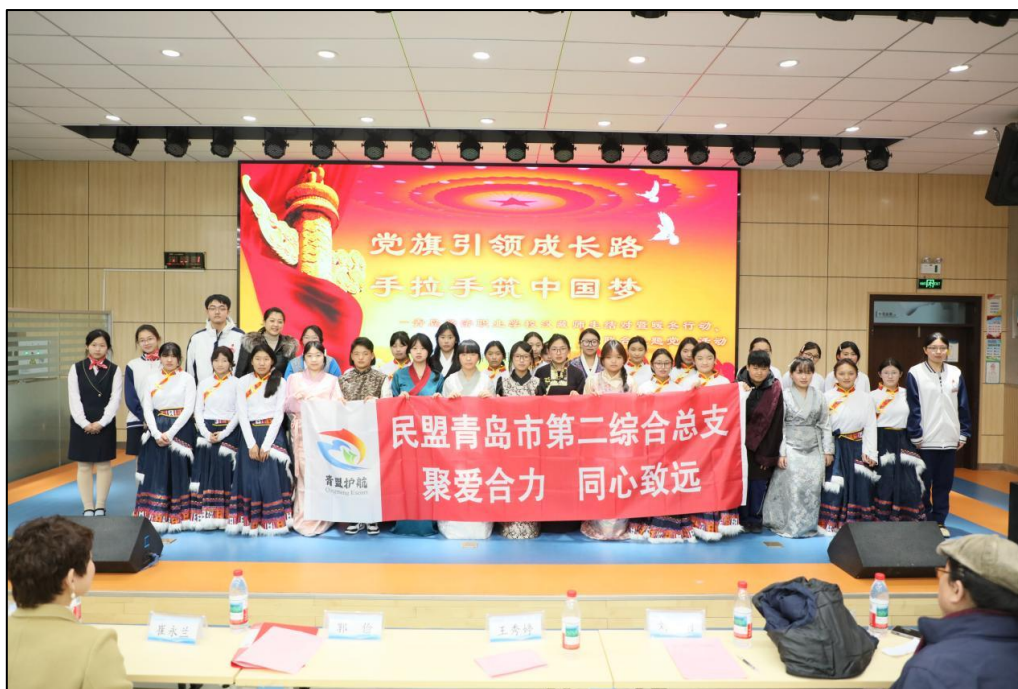
图 6-3 邀请春雨中心残疾人辅助就业中心学生表演，展现了积极乐观、自强不息的精神风貌

2. 成果量化显著，育人效果扎实。民族融合工作深入人心。通过典型发言、主题教育、结对活动、志愿服务、共同参与市级大型活动（如成人礼、团代会）等形式，汉藏师生在深度互动中增进了解与认同，相关经验在省、市级平台做交流汇报；素养育人成绩斐然。学校获评“全国急救教育试点学校”，学生在市级“技能成才强国有我”系列活动、思政微课堂、讲党史故事、近视防控宣讲等比赛中斩获多项荣誉，展现了学生综合素养的全面提升；思政教育模式获肯定。