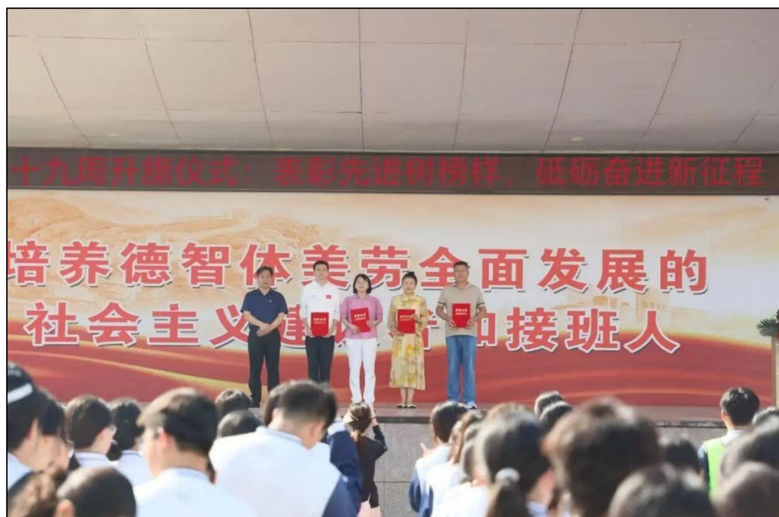
图 1-3 校领导为获得市级以上荣誉的班集体颁奖