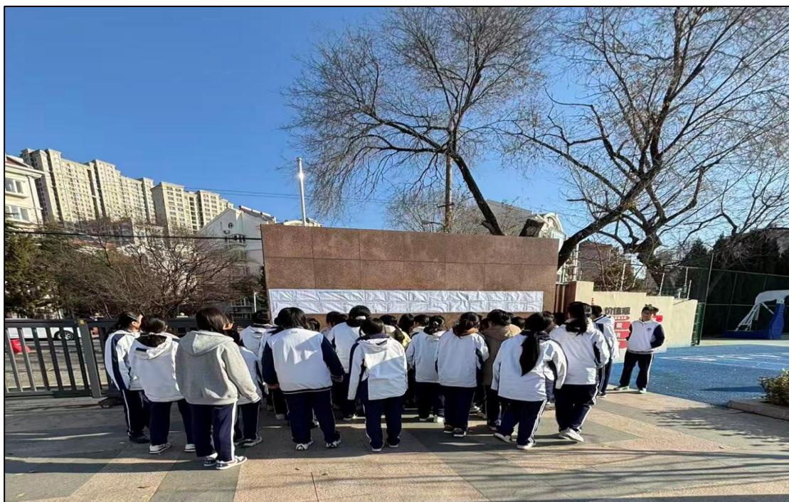
图 1-11 学生观看资助公示情况