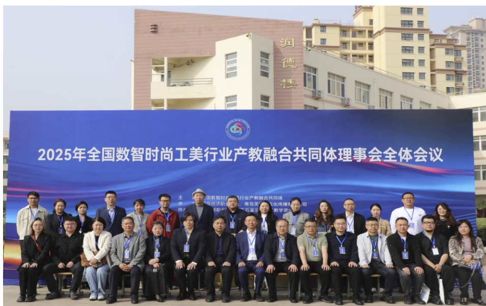
图 5-3 成功承办 2025 年全国数智时尚工美行业产教融合共同体理事会全体会议

联合发起成立全国数智时尚工美行业产教融合共同体，先后加入全国珠宝科技与艺术行业产教融合共同体、全国珠宝玉石首饰行业产教融合共同体、全国资源环境与地理信息行业产教融合共同体、全国海洋生物与健康行业产教融合共同体、全国岐黄中医药产教融合共同体、全国视光行业产教融合共同体、全国近视防控产教融合共同体、全国边境贸易产教融合共同体、黄河流域数智化纺织服装产教融合共同体、中国（山东）自由贸易试验区青岛片区现代商贸流通产教联合体、青岛上合跨境电商产业园产教联合体，为学校专业建设与发展提供了更加丰富的资源和平台。