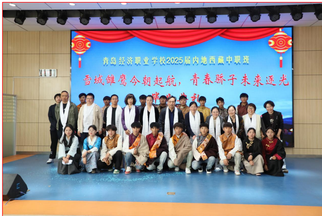
图 6-5 校领导、西藏团队和毕业生合影留念