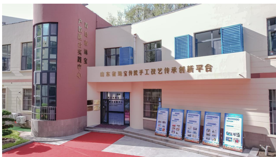
图 5-6 校企共建珠宝产教融合实践中心