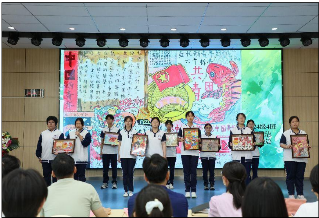
图 3-3 团员们宣讲个人手抄报内容，描绘理想、诠释信念、表达初心