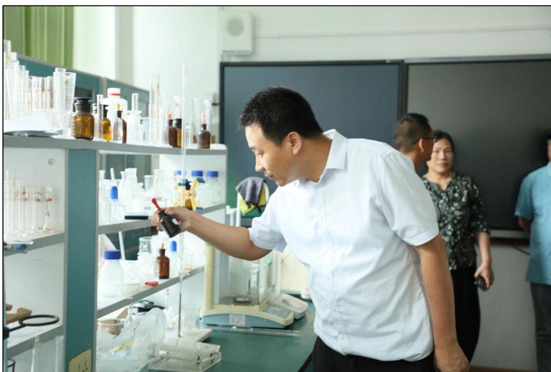
图 1-9 聘请专业安全顾问进行校园安全检查