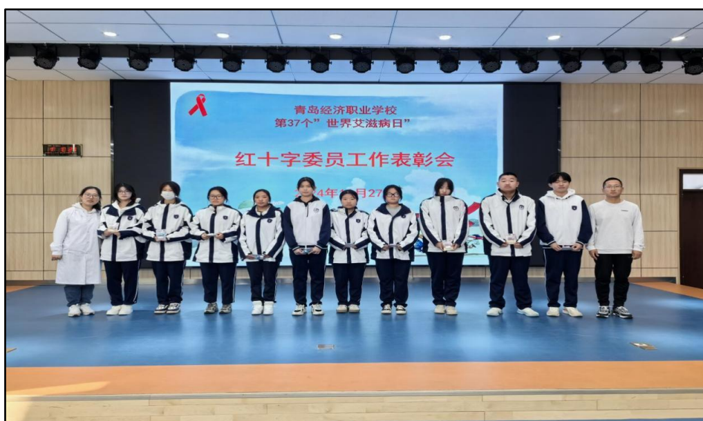
图 6-7 学校召开红十字委员工作表彰会

学校从普及急救知识与技能、配备急救设施设备、强化急救师资建设、构建急救育人体系等方面，广泛开展应急救护教育。除国旗下演讲、主题校会班会等常规仪式教育宣讲外，还特邀市红十字会专家、蓝天救援队队员、行业专家等专业人士普及急救知识技能，形成学校社会企业多方联动的教育合力；校医均持有心肺复苏证和救护员证，学校分管干部、班主任、体育教师等 20 余名也取得了心肺复苏证书，学校成立“红十字社团”、“红十字委员”队伍，每学期由校医培训心肺复苏、AED技能、急救知识技能，做到了每名“红十字委员”都熟练掌握，确保每班都有 1 名“急救员”。