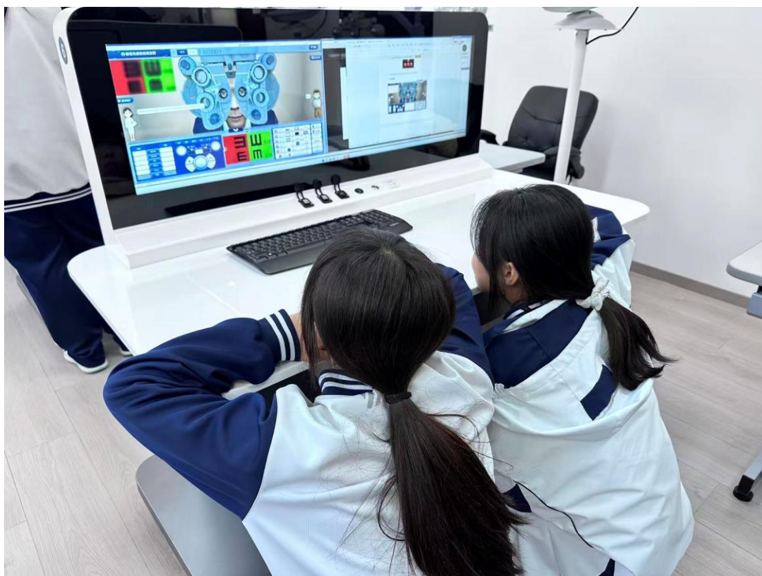
图 6-9 学生在眼视光专业数字化虚实融合实训室实训

在教学与实训条件提升方面，学校投资 297 万元建成了眼视光专业数字化虚实融合实训室，有效提升了该专业学生的实训水平；此外，投资 10 万元完成了汉藏非遗文创工坊的建设，进一步激发了珠宝专业学生的专业创新能力。