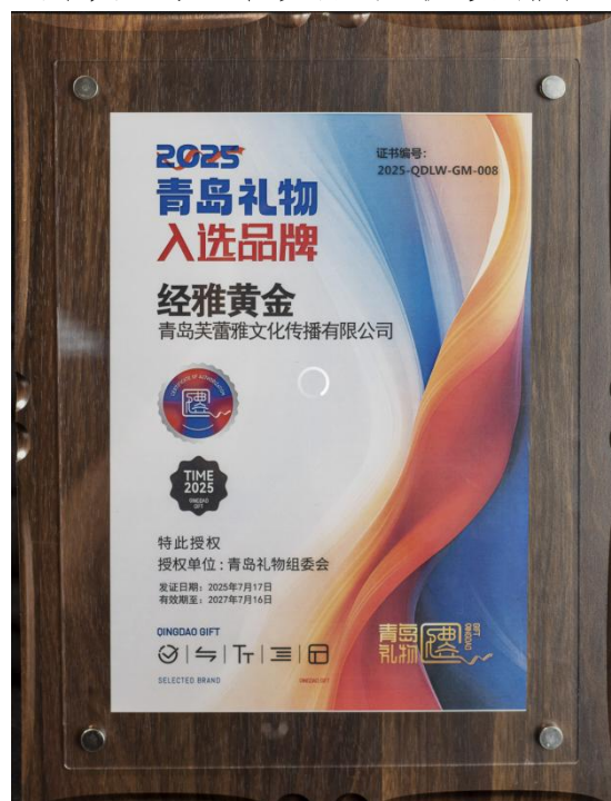
图 5-7 校企共建“经雅黄金”品牌入选青岛礼物品牌

校企携手成功注册“经雅”珠宝品牌，由学校骨干教师和优秀学生与企业技师组成珠宝创新创业团队，共同打造时尚首饰品牌，协同进行时尚首饰设计开发、新媒体营销，不断提升师生创新创业能力，推动地域珠宝产业发展。校企联合开发 20 余个系列 2000 余款时尚珠宝，校企共同申报产品外观设计专利 20 项。校企创新团队成功为奥运冠军陈梦设计制作“圆梦”套件首饰，陪伴陈梦征战奥运，在全社会引起强烈反响。2025 年，“经雅黄金”品牌入选青岛礼物品牌，学生以校企产教融合项目两获世界职业院校技能大赛争夺赛金奖第一名，两次赴天津参加世校赛排位赛。