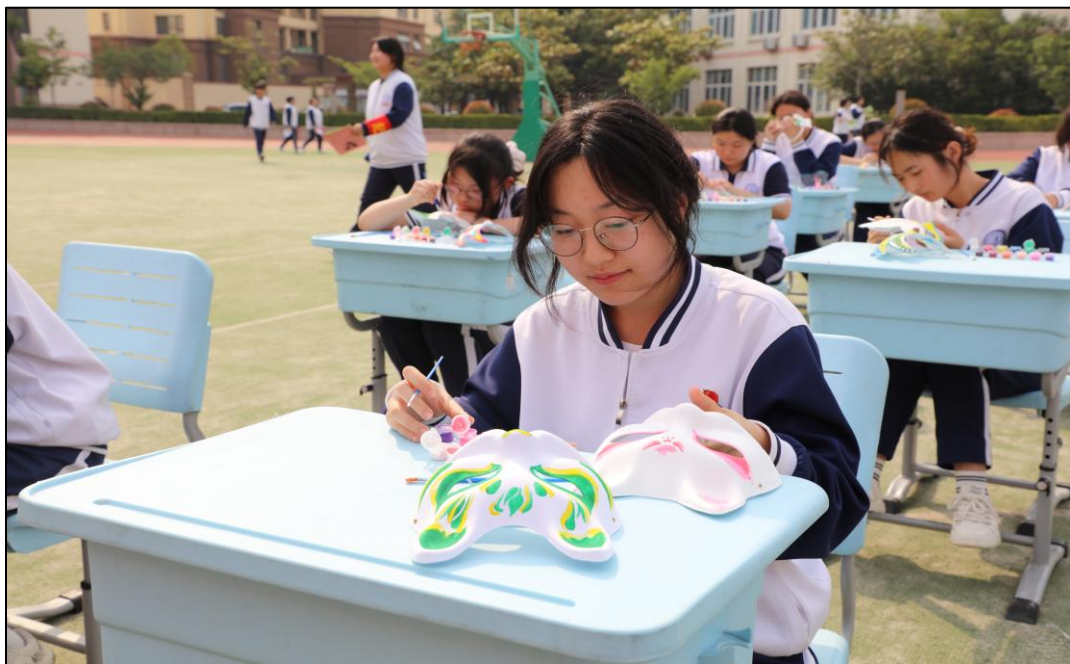
图 1-5 开展校家社协同育人宣传月暨学生心理健康宣传教育月“阳光心灵、快乐成长”心理游园活动

全体学生进行裸眼视力以及屈光度的检测，视力不良率为 89.62%，结果及时反馈家长并上传到省、市两级平台；配合疾控在藏族师生结核筛查中发现潜伏感染学生 6 名，5 名学生完成微卡注射，1 人因身体原因返藏前完成 5 针微卡注射；做实做细日常学生因病缺课、晨午检、通风消毒等，做到传染病防控早发现、早隔离、早诊断，本学期没有出现传染病疫情；联动市、区卫健资源，构建“三位一体”健康校园新体系，三月联合青岛市、市北区两级疾病预防控制中心专家，举行结核病防治知识宣讲现场会暨汉藏同心结核病防治宣传志愿服务队成立活动、五月联合举行拒绝烟草诱惑，对第一支烟说“不”主题活动，均采取“学生自主宣讲+趣味游园”的创新模式；