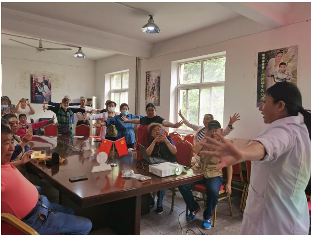
图 2-3 经济学校中药老师指导社区居民强身健体操