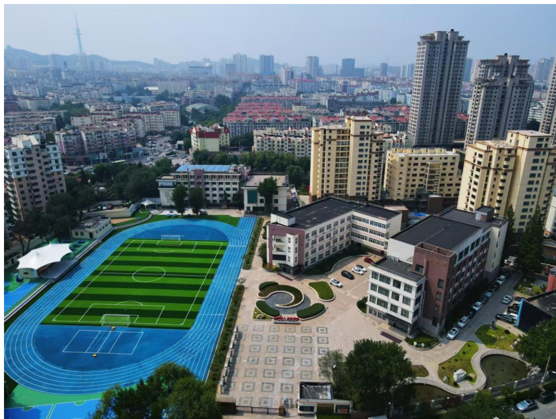
图 6-8 新改造的体育场学生提供了良好的运动场地

期存在的篮球、足球场地混设问题，学校专项投入 270 万元实施暑期改造，建成了专用场地，此举不仅消除了安全隐患，也使体育教学安排更灵活，学生运动更安全。