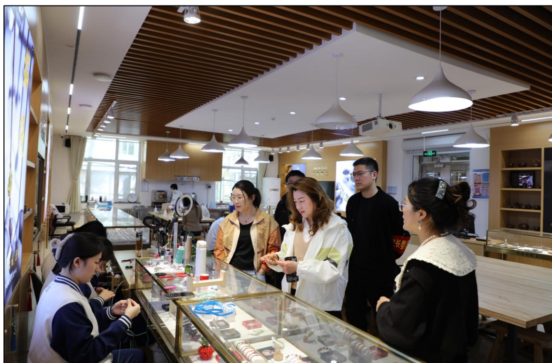
图 1-8 同心·同向·同行——学校召开家长委员会例会暨三长见面会和班级家长“八个一”驻校办公

5. 校园安全。按时完成青岛学安责任体系项目上报、安全、法治等相关网络平台的信息导入与更新；每月大检查、每周巡查，与学校安全顾问专家定期对校园周边、学校实训