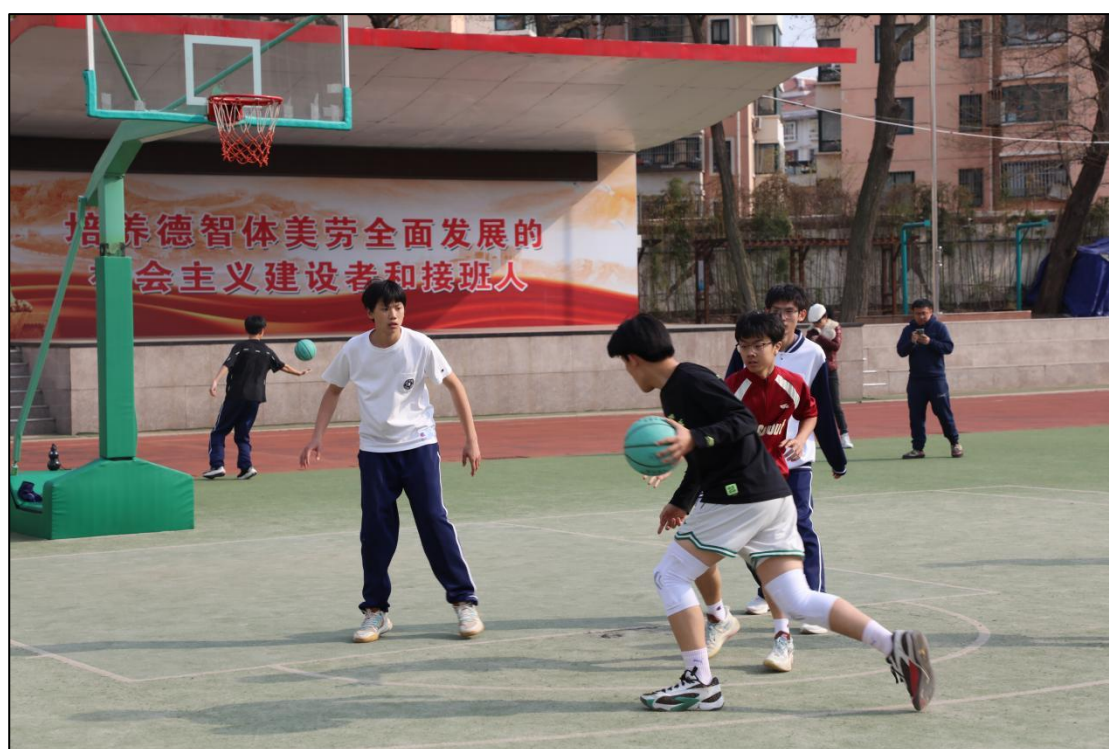
图 1-4 体育节篮球比赛

为丰富校园文化生活，增强学生体质，培养团队协作精神，学校开展为期一个月的体育节活动，体育节设置了长跳绳比赛、三人制篮球比赛、啦啦操比赛、校园吉尼斯个人挑战赛、趣味运动会、体育知识讲座、摄影比赛和短视频大赛等一系列文体活动；学校在体育节期间成功举办了班级篮球比赛。篮球赛持续一个周，吸引了全校所有班级的积极参与，为师生们呈现了一场场精彩的篮球盛宴。