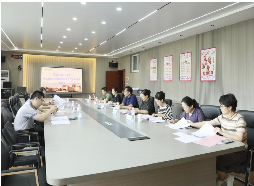
图 5-4 学校召开校企合作委员会进行混合所有制试点企业遴选

邀请相关政府管理部门、行业协会、科研机构、高等院校、企业和中职学校共同参与，成立校企合作委员会和专业建设指导委员会。通过定期召开校企合作委员会例会，安排专业建设委员会专家领导、专业带头人、骨干教师到联办高校、行业、企业调研、挂职、锻炼，加快学校发展速度，提升专业建设水平、课程开发水平、教师授课水平、学生技术技能掌握水平。