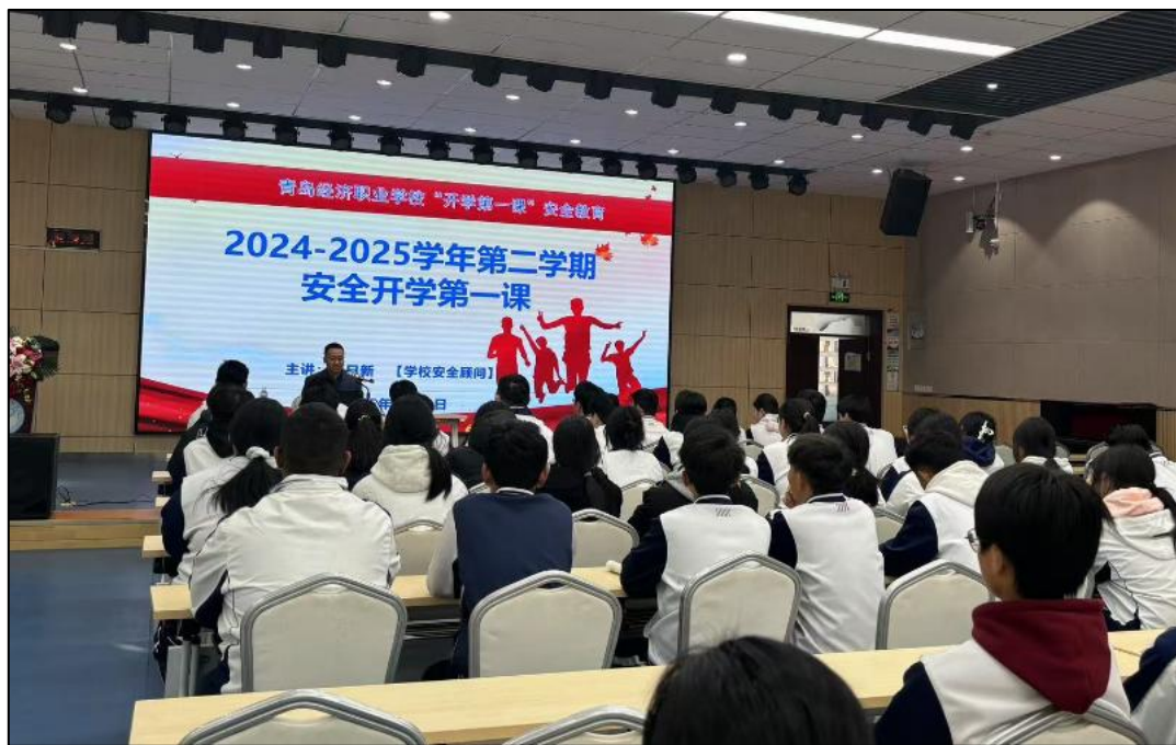
图 6-2 收看开学安全第一课

贾顾问围绕交通安全、防欺凌安全、消防安全、网络安全、食品安全以及紧急情况下的自救互救等多个方面，进行了深入浅出的讲解。他通过生动的案例分析、互动问答以及视频展示等形式，使安全知识变得既接地气又易于理解，现场气氛热烈，学生们听得津津有味，不时爆发出掌声。校园安全知识讲座不仅是一次知识的传递，更是一次心灵的触动，它提醒着每一位学子，无论在学习还是生活中，安全永远是最宝贵的财富。