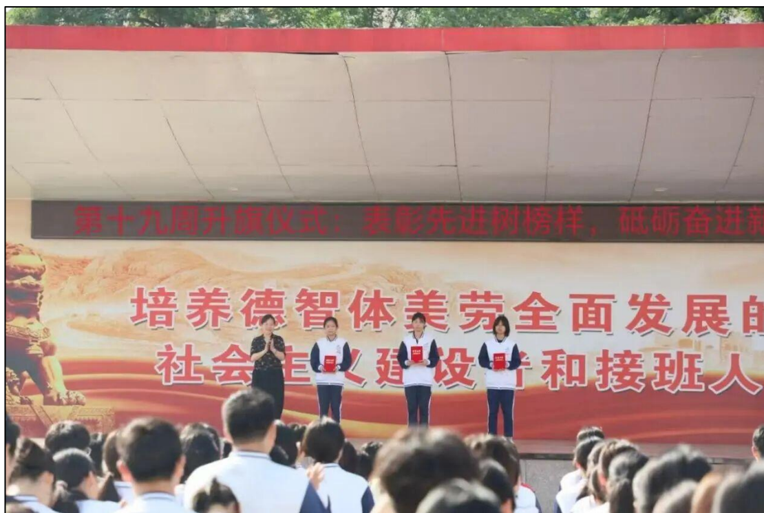
图 1-2 校领导为获得市级以上荣誉的同学颁奖