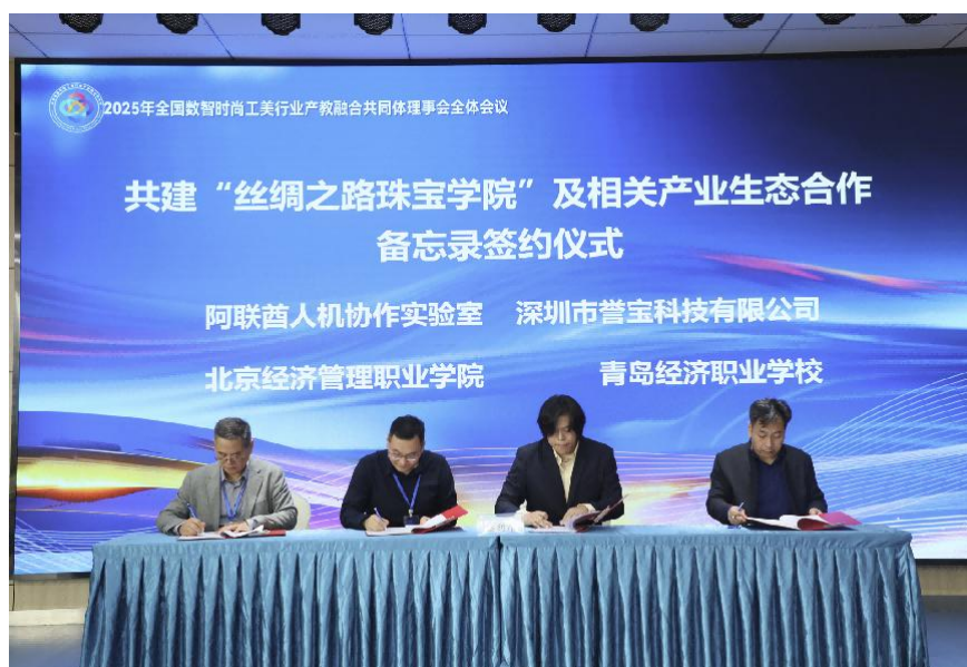
图 4-1 校企共建“丝绸之路珠宝学院”签约仪式