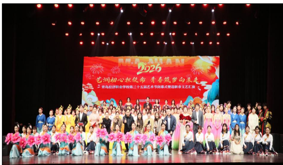
图 3-2 全体演职师生与校领导合影留念

坚持“五育并举”、深化艺术育人实践的生动缩影。学校始终将艺术教育深度融入人才培养全过程，通过系统化课程、常态化活动与专业化平台建设，不断拓展美育路径。我校积极响应青岛市教育局“十个一”项目行动计划，将掌握一项艺术技能、参加一次文艺演出等项目要求，有机融入艺术节、社团活动及日常教学之中，引导学生在感悟美、创造美、展示美的过程中全面提升综合素养。